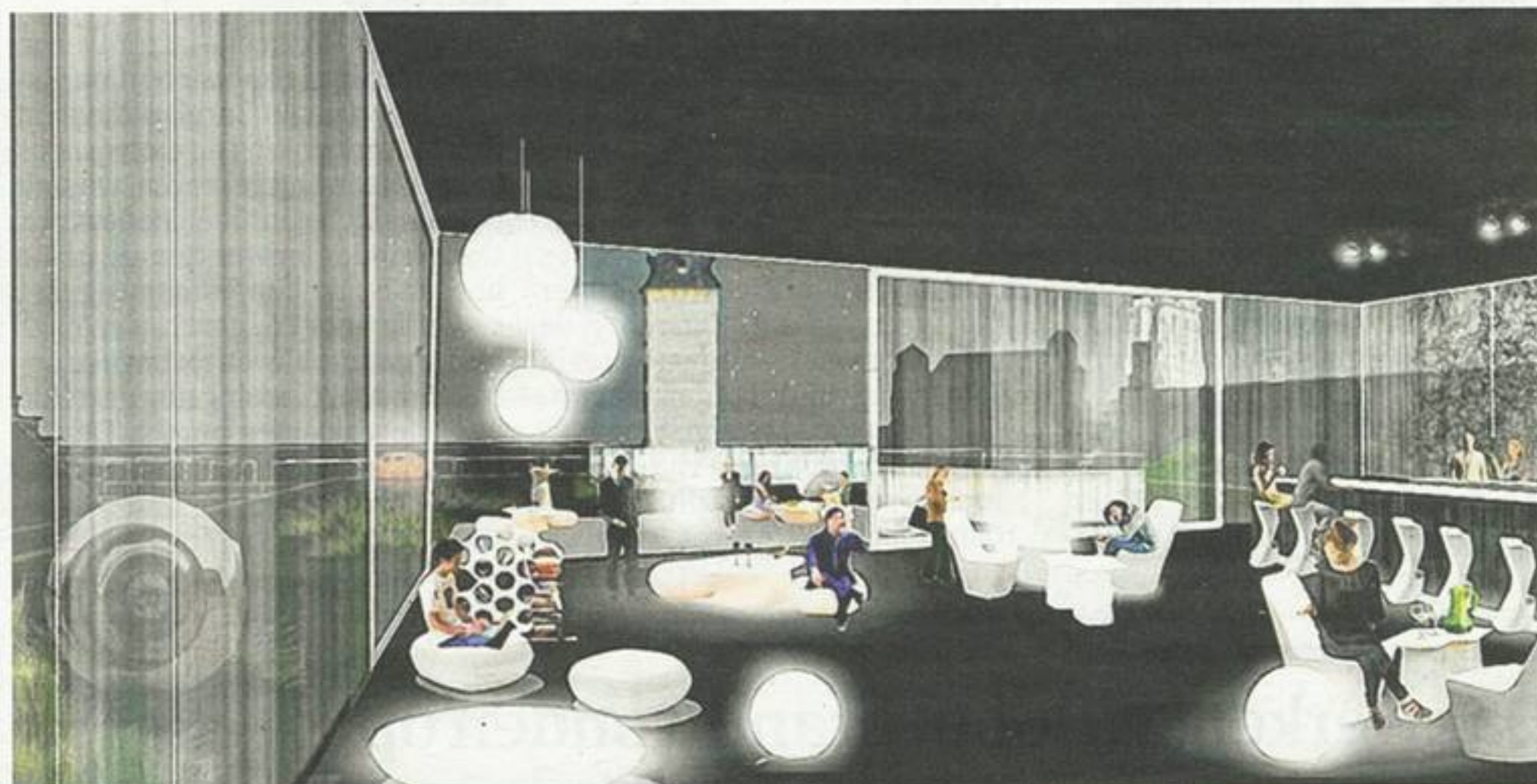
Op de hoogste verdieping is er plek voor een skybar met zicht op de toren en de Dijle.