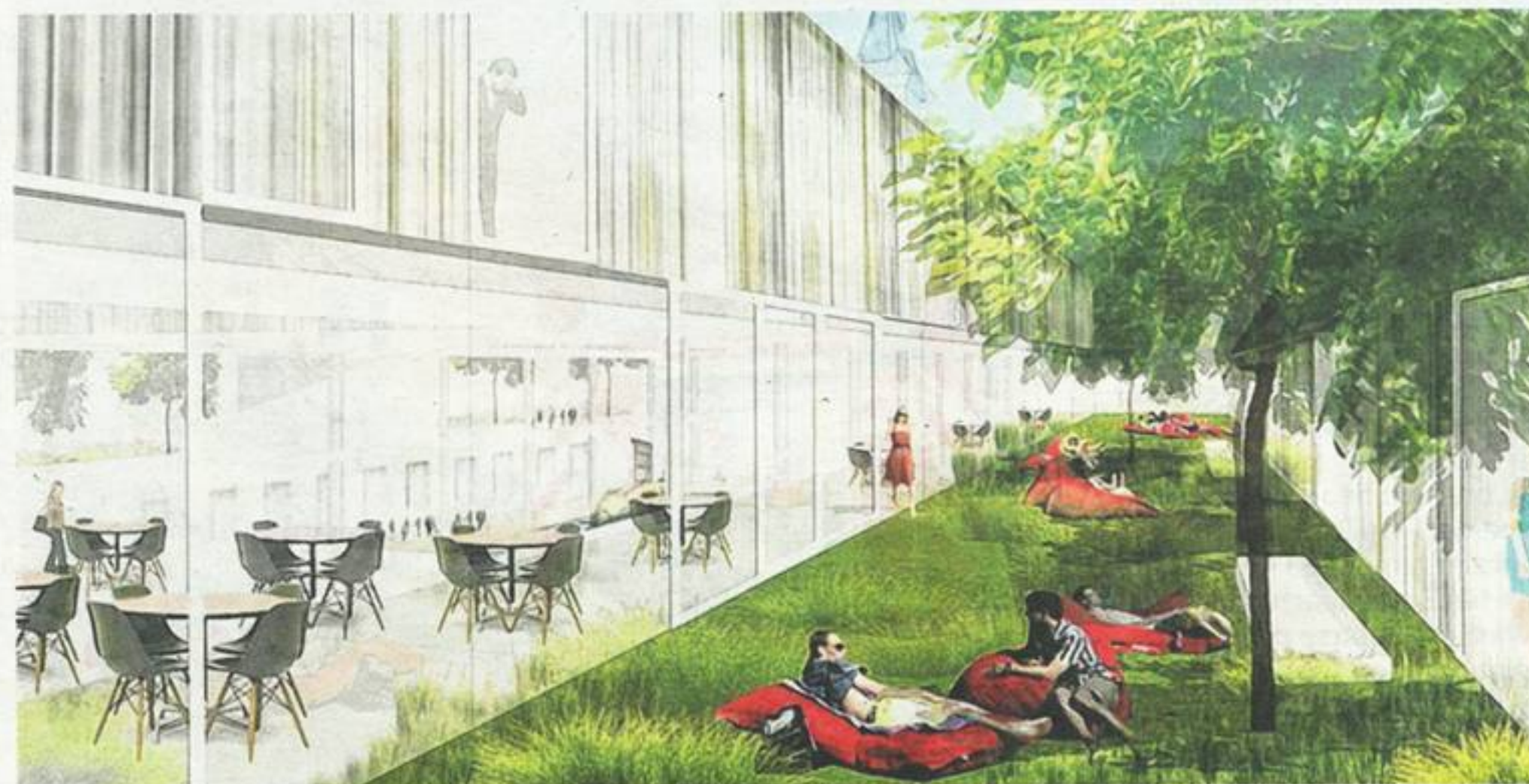
In een tussenruimte aan de rondgang van het zwembad is er ruimte voor groen. FOTO'S DMVA ARCHITECTEN