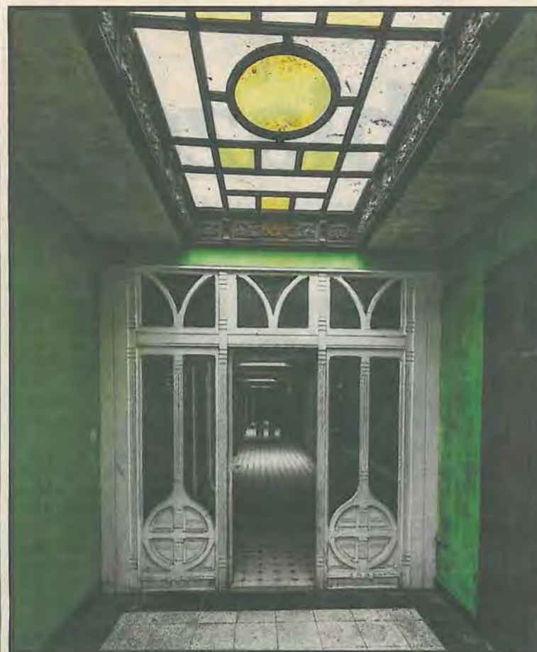
In de voormalige badengang zorgen lekken stilaan voor grote problemen. Het prachtige houtsnijwerk is gelukkig nog grotendeels intact.

Twaalf jaar leegstand en verval eisen hun tol in leegstaand monument