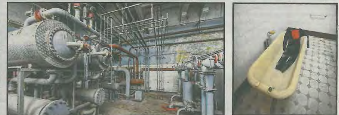
In de machinekamer moet de installatie van Monumentenzorg niet bewaard blijven.