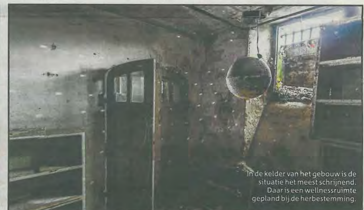
In de kelder van het gebouw is de situatie het meest schrijnend. Daar is een wellnessruimte gepland bij de herbestemming.