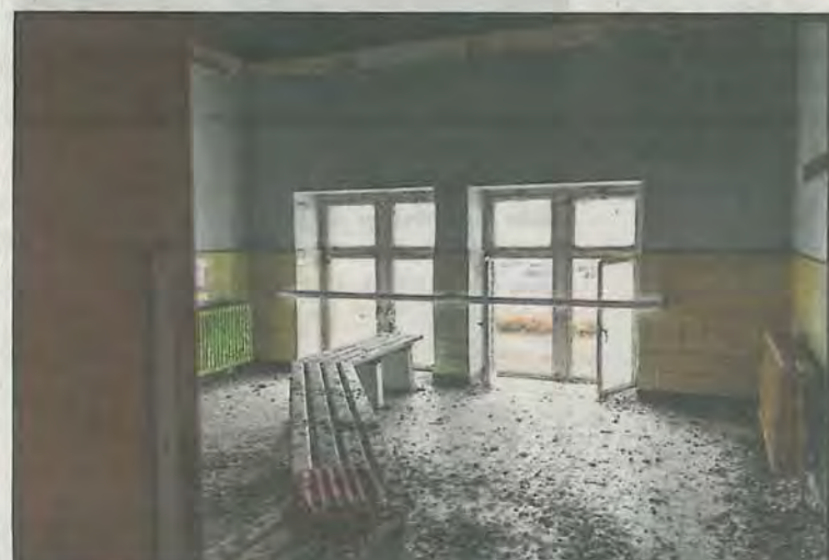
In een oude kleedkamer hebben vandalen een ruit ingegooid. De ruimte ligt vol duivendrek.